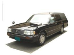
寝台車・霊柩車・バス