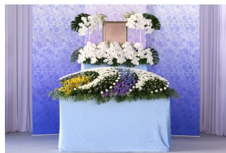
花祭壇 B タイプの場合