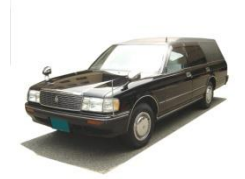
寝台車・霊柩車・バス